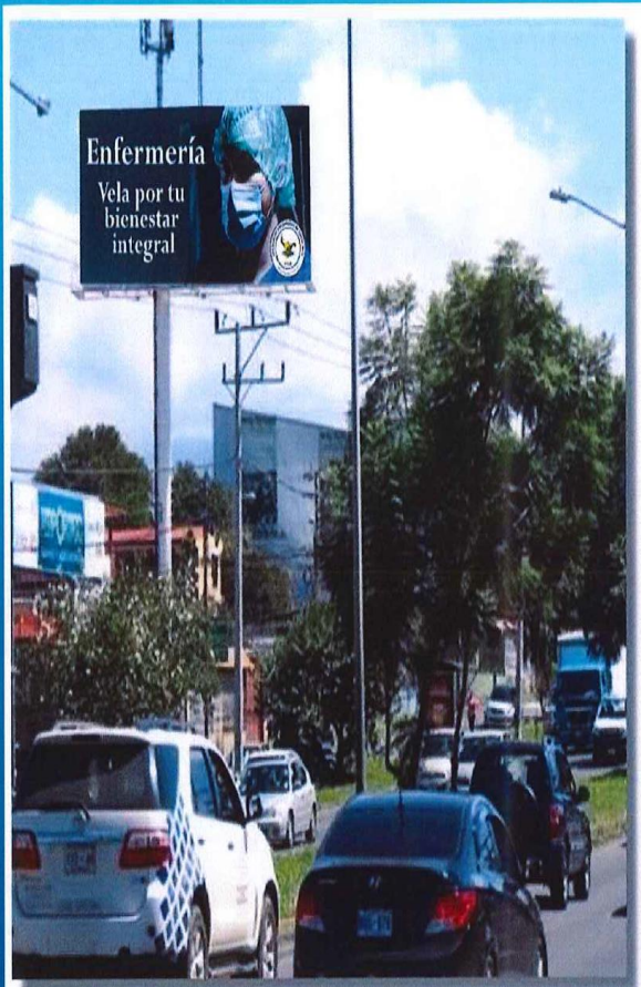
Ruta 39; circunvalación; de la rotonda de San Sebastián, 400 metros Oeste.