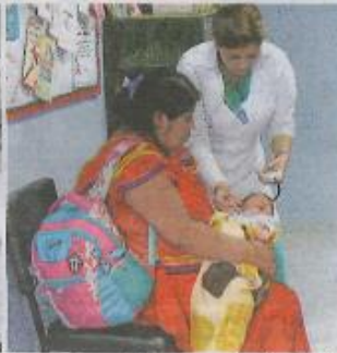
Mujeres indígenas reciben una atención de salud "híbrida" como una medida para acercarse al centro médico. Antes se veían obligadas a escoger entre su tradición y el cuidado estatal. JONATHAN