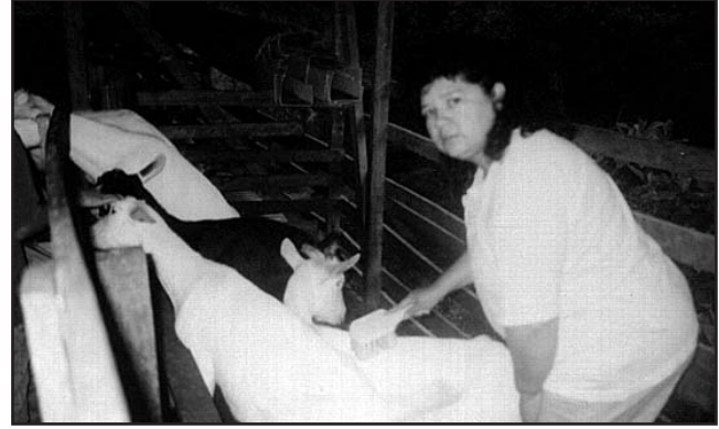
Las cabrerizas. Fundación Eco Comunidad Durika.